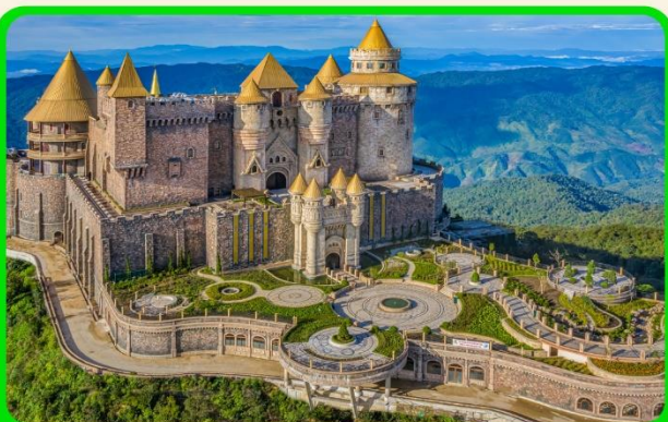
เที่ยวบานาฮิลล์แบบจุใจ เต็มวัน