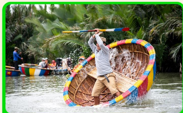
พิเศษ !!! นั่งเรือกระดัง UNSEEN เวียดนาม