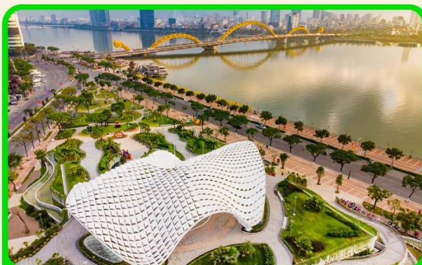
เซ็คอิน แหล่งที่เที่ยวยุคใหม่ APEC PARK